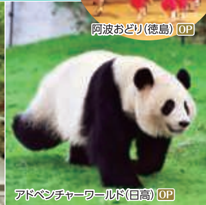
アドベンチャーワールド(日高) OP