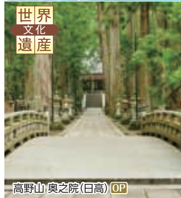
高野山 奥之院(日高) OP